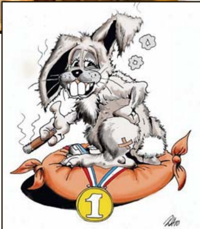
HEDRET: Harstad-laget stakk av med denne premien for å ha vært kjappast med å melde seg på konkurransen.